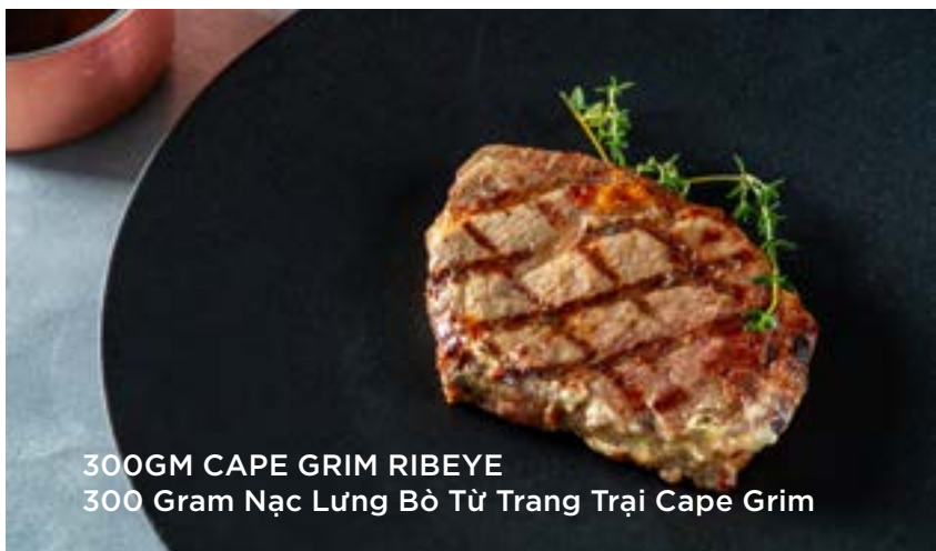
300GM CAPE GRIM RIBEYE 300 Gram Nạc Lưng Bò Từ Trang Trại Cape Grim