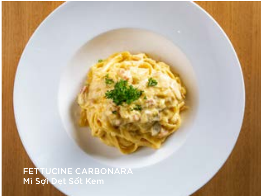
FETTUCINE CARBONARA Mì Sợi Dẹt Sốt Kem