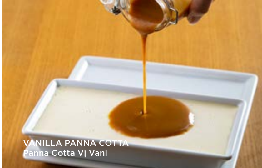
VANILLA PANNA COTTA Panna Cotta Vị Vani