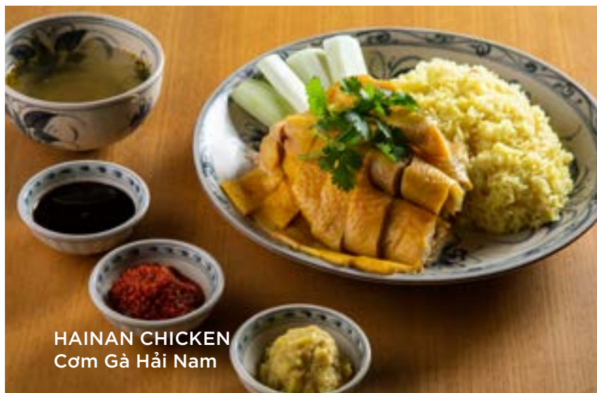
HAINAN CHICKEN Cơm Gà Hải Nam