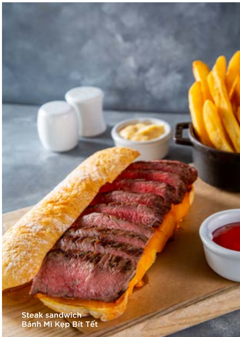
Steak sandwich Bánh Mi Kẹp Bít Tết