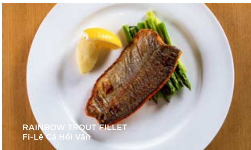
RAINBOW TROUT FILLET Fi-Lê Cá Hồi Vân