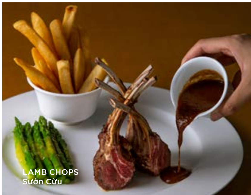
LAMB CHOPS Sườn Cừu