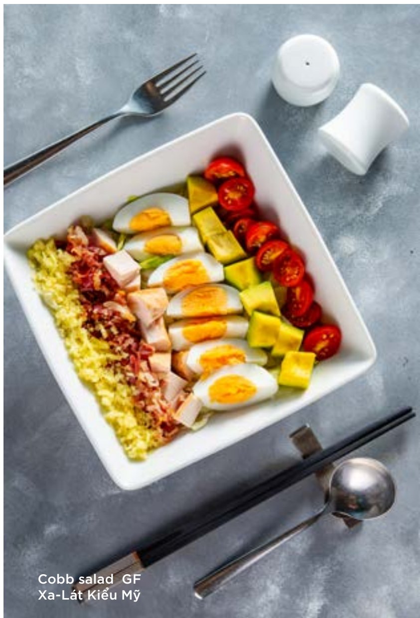
Cobb salad GF Xa-Lát Kiểu Mỹ