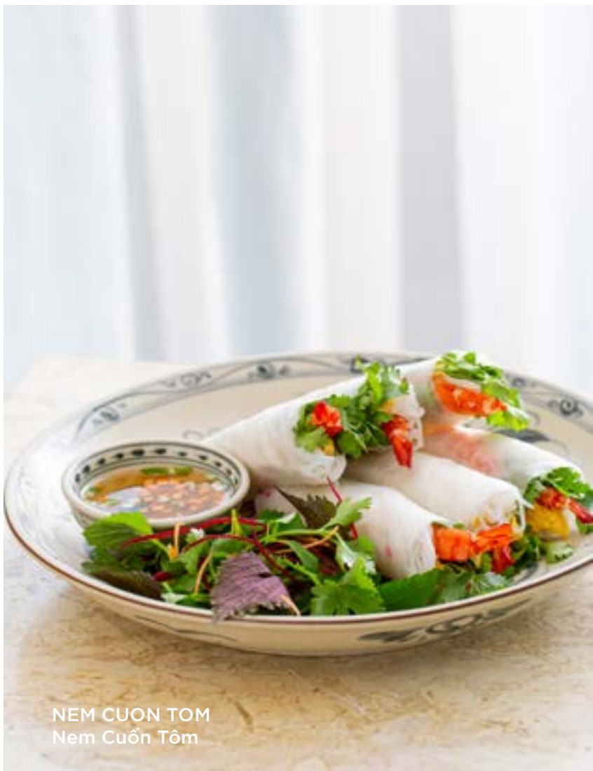
NEM CUON TOM Nem Cuốn Tôm