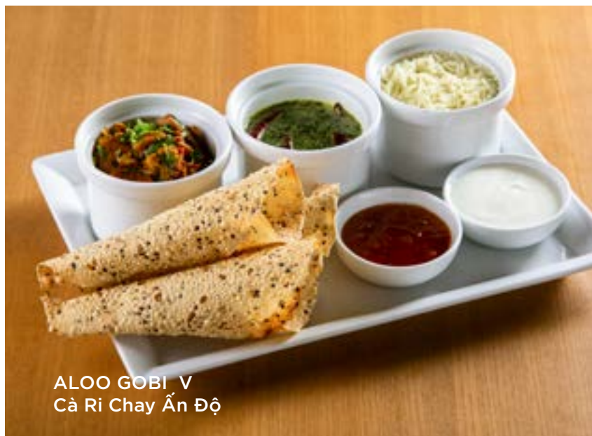
ALOO GOBI V Cà Ri Chay Ấn Độ