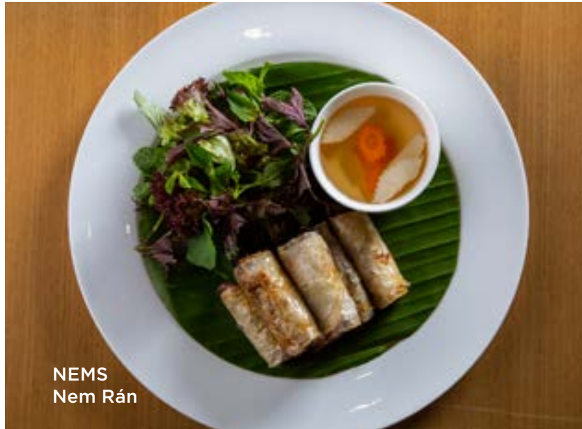
NEMS Nem Rán