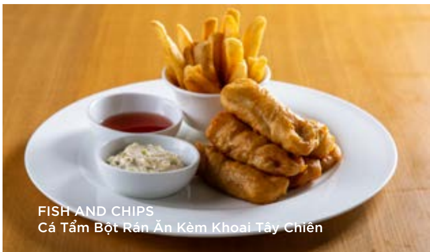
FISH AND CHIPS Cá Tầm Bột Rán Ăn Kèm Khoai Tây Chiên