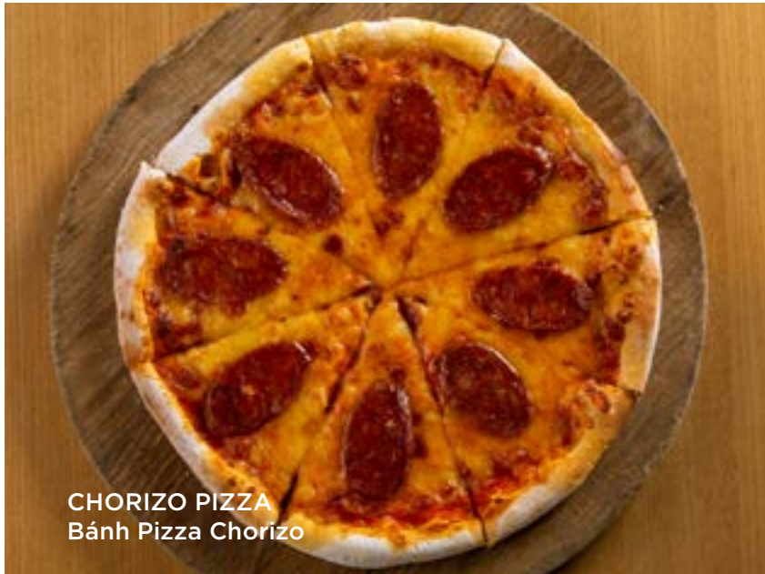
CHORIZO PIZZA Bánh Pizza Chorizo