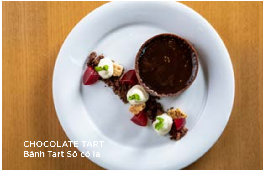
CHOCOLATE TART Bánh Tart Sô cô la